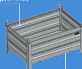
Dno palety vystužené profily